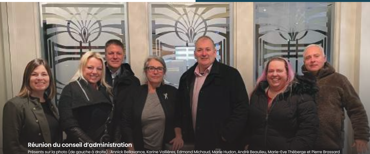
Réunion du conseil d'administration

Nombre de postes vacants au sein du conseil d'administration : 2